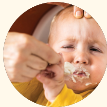
Presión de los padres para comer.