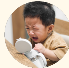
Niños que son muy sensibles.