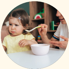
Introducción tardía a los alimentos grumosos.