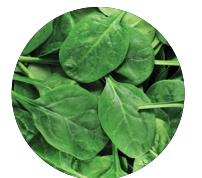
গাঢ়, সবুজ পাতা বিশিষ্ট সব্জি