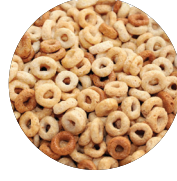
WIC অনুমোদিত খাদ্যশস্য