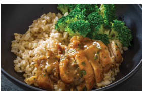
স্টিকিয়ার ফ্রায়েড চিকেন