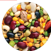
লেগুমস (মটর, বিনস, ডালজাতীয় শস্য)